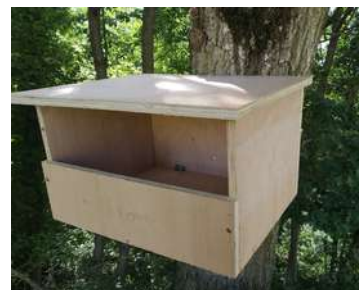
Nichoir à Faucon crécerelle

Passionné par l'agriculture et ses enjeux environnementaux, ancien salarié en GAB, il cherche des solutions qui vont dans le sens d'une cohérence de notre lien avec le vivant. 25 000 nichoirs installés en fermes par Agrinichoirs.