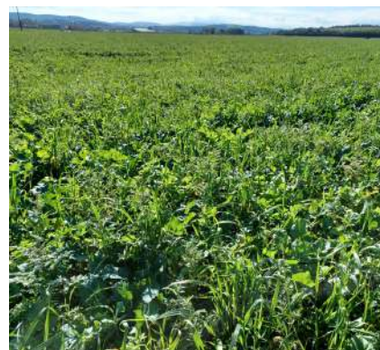
photo AGRIBIO couverts au 23/10/2024 - 4.5tMS/ha

Choisir les espèces de couverts adaptées à son interculture, avec des résultats techniques intéressants Etre capable de les planter et de les détruire, en bio Trouver des solutions techniques pour les couverts estivaux Pouvoir évaluer leur impact économique de manière simple