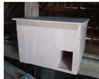
Nichoir à Chouette chevêche et effraie